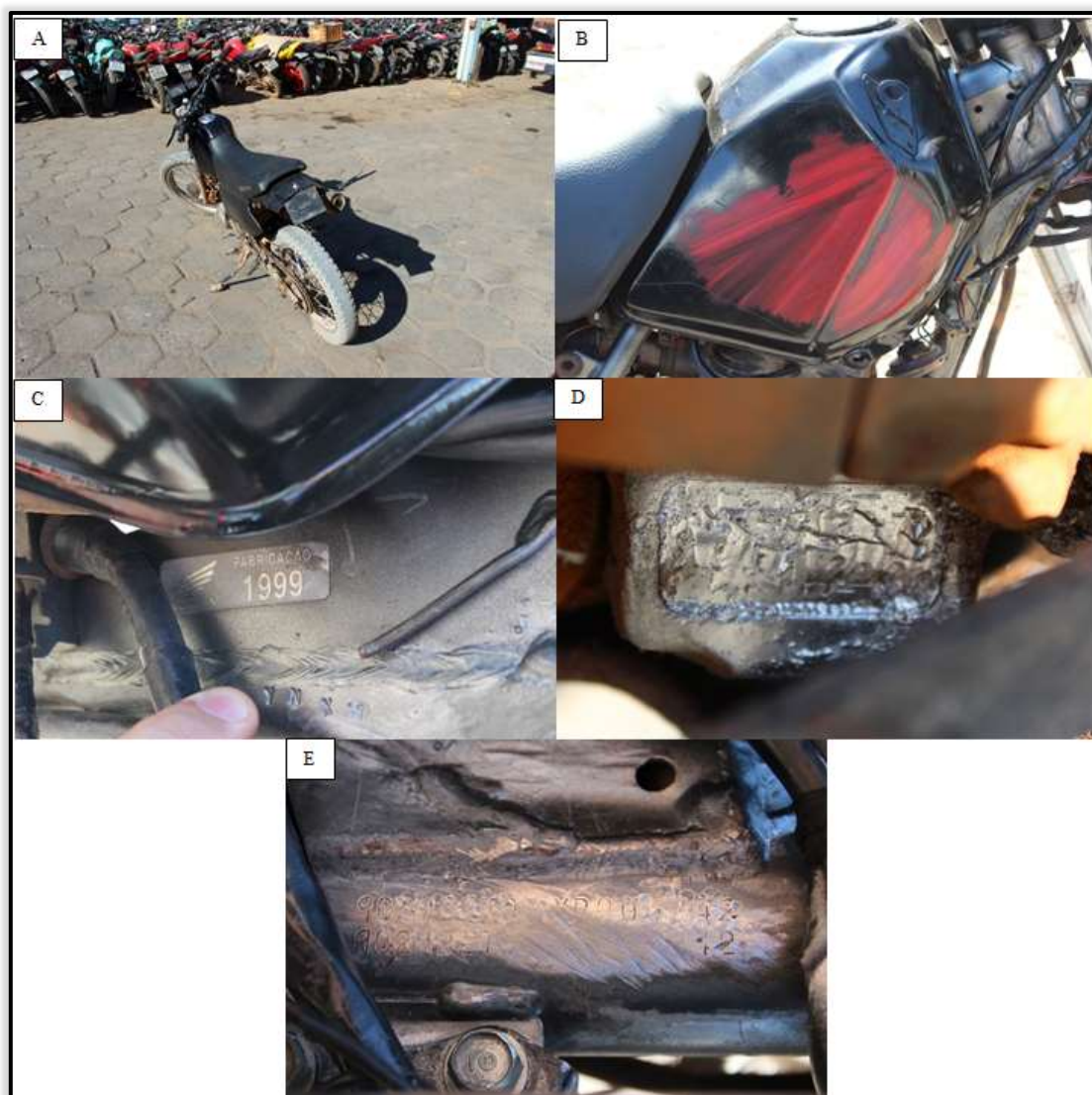
Figura 1. Vista macroscópica da estrutura veicular e de seus elementos identificadores, antecedente ao ensaio químico. (A) Setores posterior e esquerdo da motocicleta. (B) Pintura em cor vermelha subjacente a preta disposta no tanque de combustível. (C) Plaqueta, indicativa do ano de fabricação da motocicleta, afixada ao chassi veicular. (D) Supressão integral da sequência alfanumérica do motor. (E) Supressão parcial do NIV (chassi).